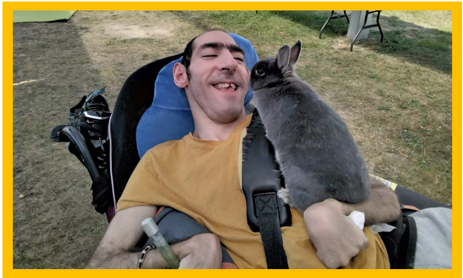
Médiation animale avec Pitie

Les professionnels veillent à son confort et à son bien être pour qu'il puisse continuer à profiter au maximum de ce qui le rend heureux et lui fait plaisir.